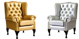
ein Statement extravagant präsent & repräsentativ anregend auffallend