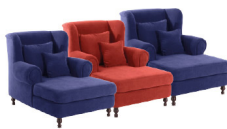
Drei oder mehr dieser Sessel anstatt eines Sofas. So dicht beieinander & so bunt wie man mag.

© ohrensessel-mit-stil.de 2015 - Produktbilder von Max Winzer